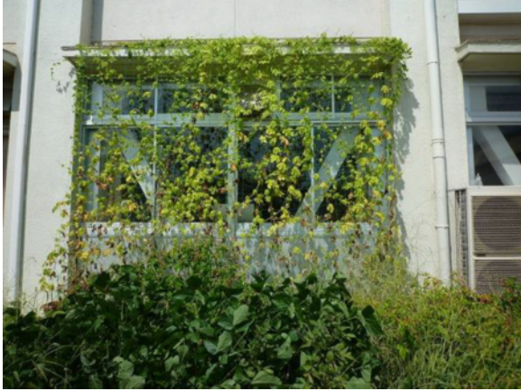
校舎の南面に緑のカーテン（ゴーヤ）

専門員：苗の植え付けと、支柱やネット張りは大変良好でしたが、灌水が過剰になった事と枝の扱いは、やや問題がありました。ネットの面積を倍にして、親づるを取り、子づる・孫づるを誘引しながら横に拡げてあげるとよい。