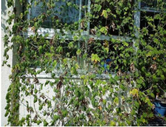
北舎の南面に緑のカーテン (ゴーヤ、あさがお)

専門員： 夏休みの灌水等の管理は大変です。また、土の補充、追肥など、十分に手入れをすると良い。