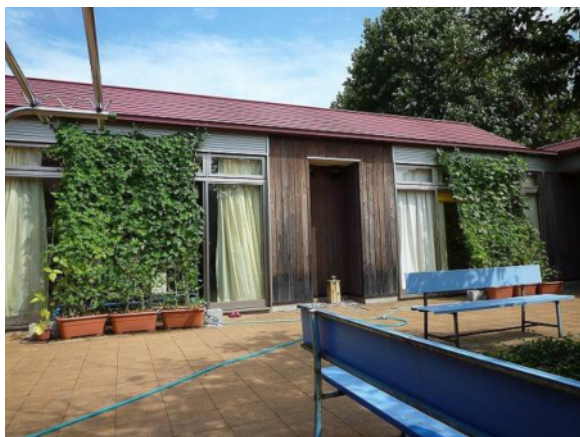
本舎の西面及び南面に緑のカーテン (ゴーヤ、あさがお)

先生： 緑のカーテンを育てることで、自然と触れあうことができ、いつもと違う体験ができて良かったです。