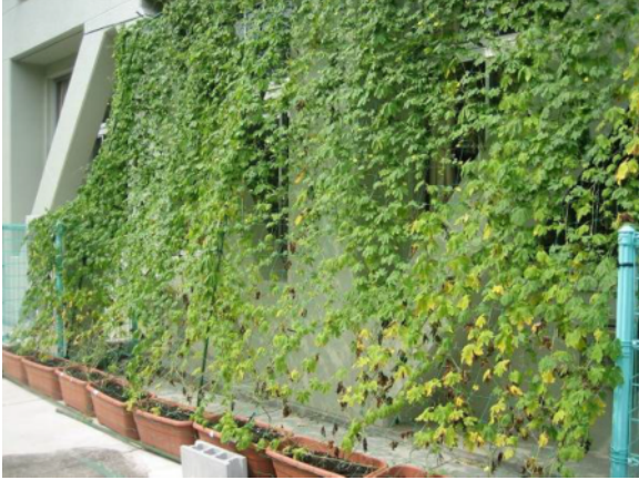
北舎の南面に緑のカーテン（ゴーヤ）

先生： 緑のカーテンがある部屋では、ゴーヤの葉を通して、やわらかくちょうど良い陽ざしが入るようになり、同時に蒸散効果で気温も下がるせいか、入ってくる風も涼しく感じられました。