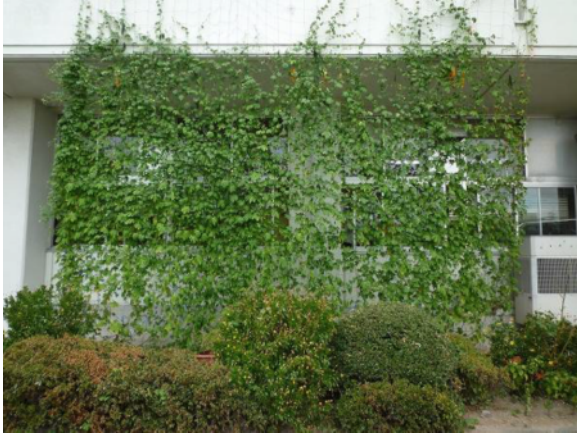
本舎の南面に緑のカーテン（ゴーヤ）

先生： 子どもたちが少しでも、地球のことや自然のことに興味を持てることができ、実感できるよい機会でした。また、緑のカーテンがあると涼しく感じるので、それぞれの家庭でも取り組めれば、温暖化防止になると思います。