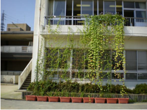
南舎の南面に緑のカーテン (ゴーヤ、あさがお)

教頭先生：子どもたちの環境に対する関心を高めるだけではなく、保護者や地域の方にも関心をもってもらったので良かった。