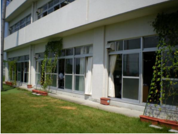
本舎の南西面に緑のカーテン (ゴーヤ、あさがお)

先生：生徒たちが、当番を決めて水の管理などをしたり、あさがおが咲くと喜んだり、興味を持ちながら取り組んでくれました。学校行事の1つとしてよいものに取り組みました。