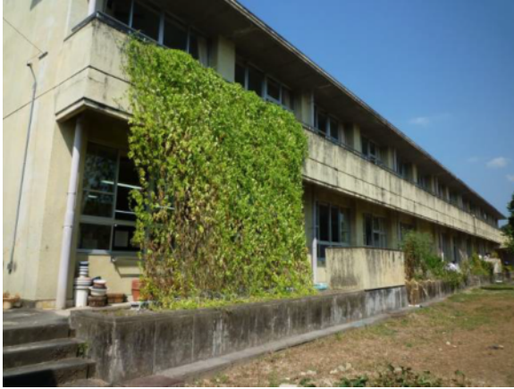
南舎の南面に緑のカーテン（ゴーヤ）

先生：プランターではなく、花壇に直接植えることでゴーヤの生長が良く、順調に栽培することができました。生徒の心を育てる活動の一つとなり、とても良かったです。