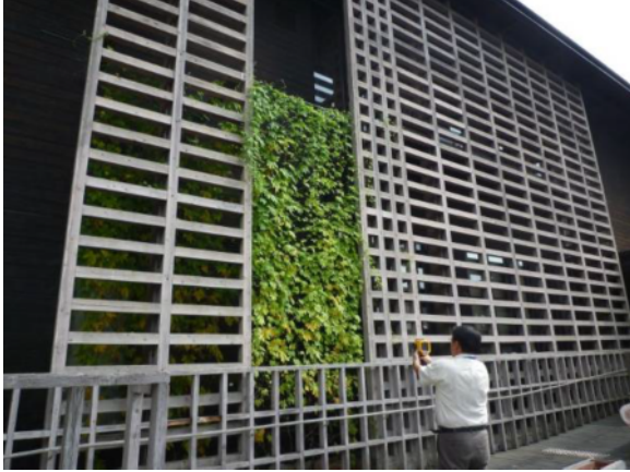
校舎の北西面に緑のカーテン（ゴーヤ）

先生：最も暑かった時期には、日陰の効果と蒸散効果で体感温度が下がったことを実感しました。