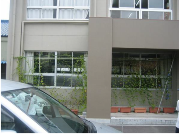
西館の東面に緑のカーテン (ゴーヤ、あさがお)

先生： 育てた生徒たちは、カーテンの緑を意識して、球技大会のユニフォームを緑色にしました。それぐらい関心を持って取り組めた。