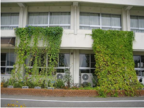
中舎の西面に緑のカーテン (ゴーヤ、あさがお)

教頭先生： 緑のカーテンを設置した職員室では、エアコンの使用頻度が減りました。室内が涼しくなり、職員の作業がはかどりました。また、枯らしてはいけないという気持ちで、いっぱい愛情を注いで育てることができました。