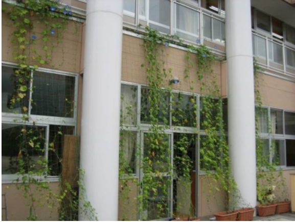
北舎の南面に緑のカーテン (ゴーヤ、あさがお)

先生：日照時間が足りなかった ので、生育が思わしくな かったが、窓の外に緑が見 えるということで、涼しさを感じ ることができました。