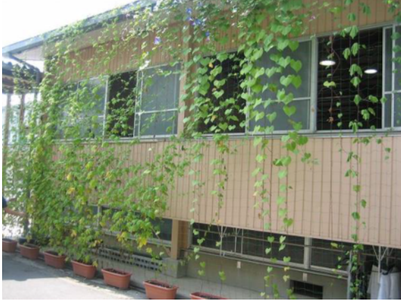
格技場の南面に緑のカーテン (ゴーヤ、あさがお)

先生：生長を見届ける生徒ばかりで、かなり愛着がわいていたと思う。成育状況を見ながら、「来年は家でやってみよう！」とか、実際に今年から始めた人、また、家の植物と比べている人が多数いました。