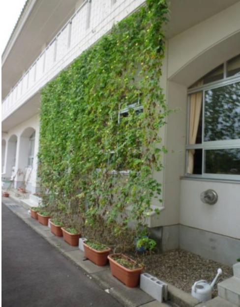
南舎の南面に緑のカーテン（ゴーヤ）

先生： 1階に置いたプランターからゴーヤが2階まで伸びていき、緑のカーテンと呼ぶにふさわしい姿になりました。窓の外に緑が見えて、さわやかな感じがしました。見た感じでも、涼しく思いました。