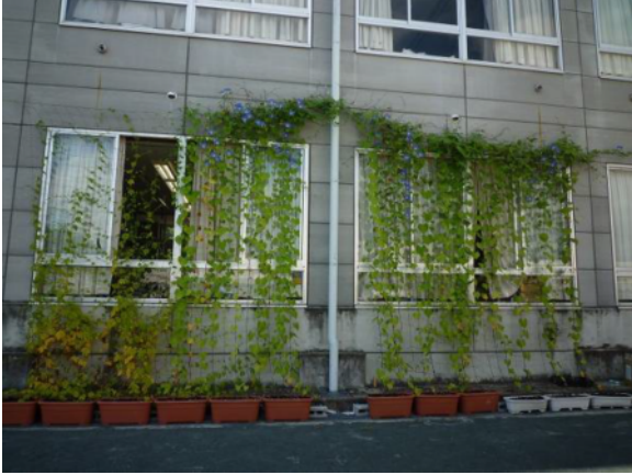
本舎の東面に緑のカーテン (ゴーヤ、あさがお)

先生：視覚的にも、感覚的にも涼しく感じ、緑があることの大切さと同時に温暖化への危機感も再認識しました。来年度は、規模を拡大し、環境の授業との関連も考えながら実施したい。