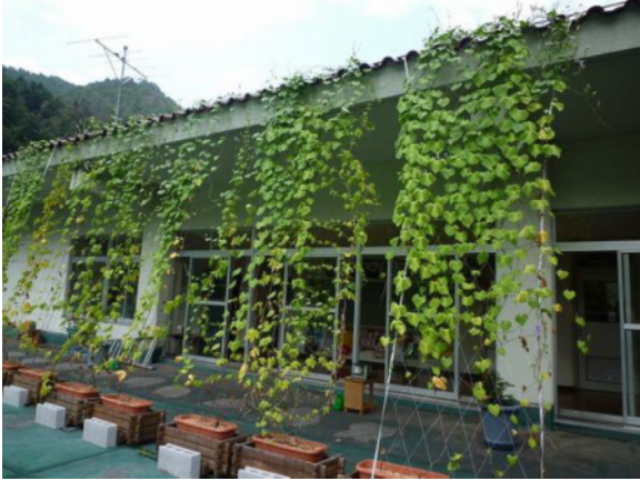
校舎3階ベランダの南西面に緑のカーテン (ゴーヤ、あさがお)

教頭先生：7月が雨続きだったため、生長が遅れたが、緑のカーテンを設置することにより、ベランダに陰ができて照り返しが押さえられ、廊下が涼しく感じられました。