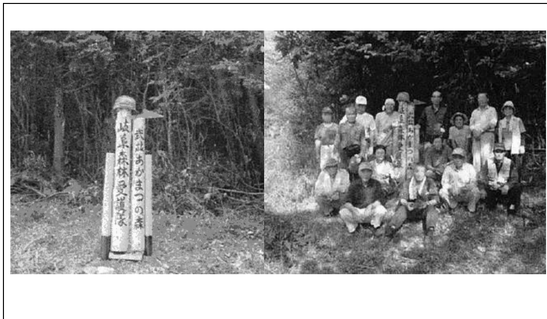
（実施日：平成 21 年 9 月 26 日(土) ） （事業名：森林整備活動（恵那武並） ）