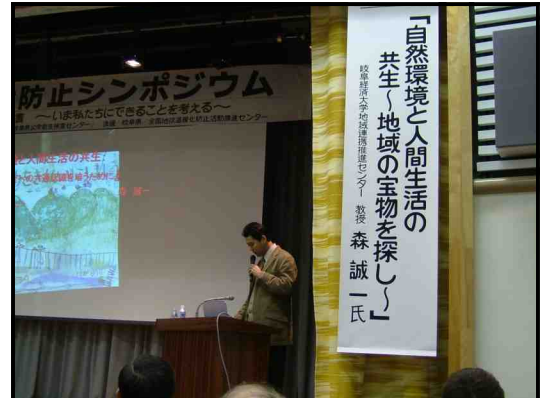
地球温暖化防止シンポジウム 特別講演 (平成17年12月1日 各務原市にて)

シンポジウムでは、講演会や各務原市周辺の学校・企業・市民団体で実践されている地球温暖化防止活動の事例発表を行い、参加していただいた皆様に「いま地球温暖化を防ぐためできることは何なのか」を考えていただきました。