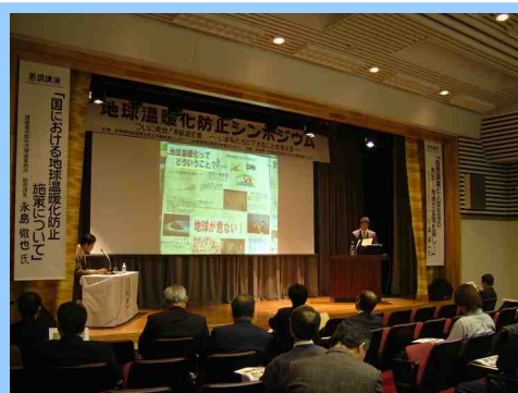
地球温暖化防止シンポジウム 事例発表 (平成17年12月1日 各務原市にて)