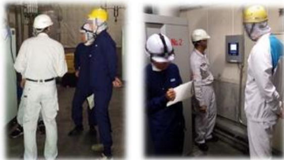
※(一財)省エネルギーセンターによる診断

省エネ診断を実施した専門家から、 診断結果の報告会で約10項目の 省エネ提案があった。 具体的な提案と支援があり、 やる気が復活。